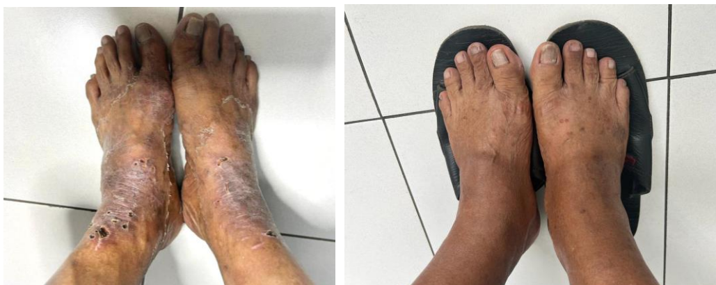
Gambar 1. A. Lesi sebelum fototerapi. B. Lesi sesudah fototerapi 8x dengan interval 2 kali per minggu selama 4 minggu.

Fototerapi dengan NB- UVB telah diketahui dapat mengurangi derajat keparahan DA berdasarkan nilai SCORAD hingga 50% (Tintle et al., 2011), EASI 40% (Kwon et al., 2019). Hal yang sama juga didapatkan dalam penelitian ini, penurunan keparahan pasien DA pada kelompok intervensi berdasarkan SCORAD mencapai 58%, dan EASI 51% dan ADSI 43% sehingga perbaikan klinis pun sangat tercapai (Gambar 1).